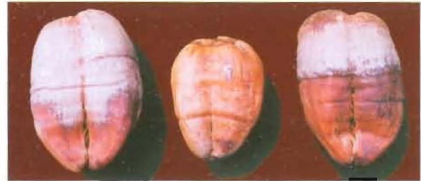
തേങ്ങയുടെ പുറംഭാഗത്തെ വീളളലുകൾ

ബോറോണിന്റെ ലഭ്യത കുറവ് രൂക്ഷമാകുമ്പോൾ ഓലകളുടെയും ഓലക്കാലുകളുടെയും എണ്ണത്തിൽ വളരെ കുറവുണ്ടാകാറുണ്ട്. ചിലപ്പോൾ ഓലക്കാലുകളുടെ അറ്റം വളഞ്ഞ് ചാട്ടപോലെയാകുന്നതും കണ്ടുവരുന്നു. ചില ഓലമടലുകളുടെ പുറം വരണ്ട് വീളളലുകളും കരിച്ചിലും ഉണ്ടാകും. കായ്പഫലമുള്ള തെങ്ങുകളിൽ പൂങ്കുലകൾ ഉണ്ടാകുവാൻ താമസം നേരിടും. പിന്നീട് മച്ചിങ്ങാ പൊഴിച്ചിലും കാണാറുണ്ട്. തേങ്ങയുടെ പുറംഭാഗത്ത് വീളളലുകൾ ഉണ്ടാവുകയും ശരിയായ രീതിയിൽ കാമ്പുണ്ടാകാതിരിക്കുകയും ചെയ്യും. കൊപ്രയുടെ ഗുണമേന്മയെ ഇതു ബാധിക്കും.