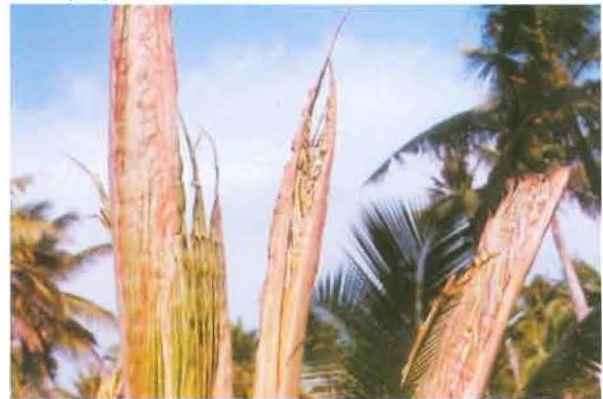
ഓലകൾ വിരിയാത്ത അവസ്ഥ

ബോറോണിന്റെ അഭാവ ലക്ഷണങ്ങൾ കാണുവാൻ സാധിക്കുന്നു. തെങ്ങിന്റെ തെങ്ങുകളിൽ ഓലകളിലെ രൂപ വ്യത്യാസത്തോടൊപ്പം ഓലക്കാലുകളുടെ അഗ്രഭാഗം ഒട്ടിച്ചേർന്ന് വിരിയാത്ത അവസ്ഥയുണ്ടാകും. തളിരോലകൾ വിടരാതെ നാമ്പിനുചുറ്റും തിങ്ങിക്കൂടി വളരുകയും വിരിയുന്നതിനു തടസ്സമായി മണ്ട മുരടിപ്പ് ഉണ്ടാകാനുമാണ്. ഈ അവസ്ഥയെ 'മണ്ടയടപ്പ്' അഥവാ 'കുമ്പടപ്പ്' എന്ന് പറയുന്നു.