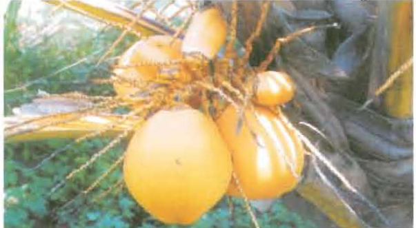
ഒരേ കുലയിൽ വലുതും ചെറുതുമായ തേങ്ങകൾ

മൂടപ്പെടാത്ത തേങ്ങ കുലകളിൽ തന്നെ ഉണങ്ങി തുങ്ങിക്കിടക്കാറുണ്ട്. ചിലപ്പോൾ വളർച്ചയെത്തിയ തേങ്ങയോടൊപ്പം തന്നെ വളരെ ചെറിയ തേങ്ങയും കാണുവാൻ സാധിക്കും.